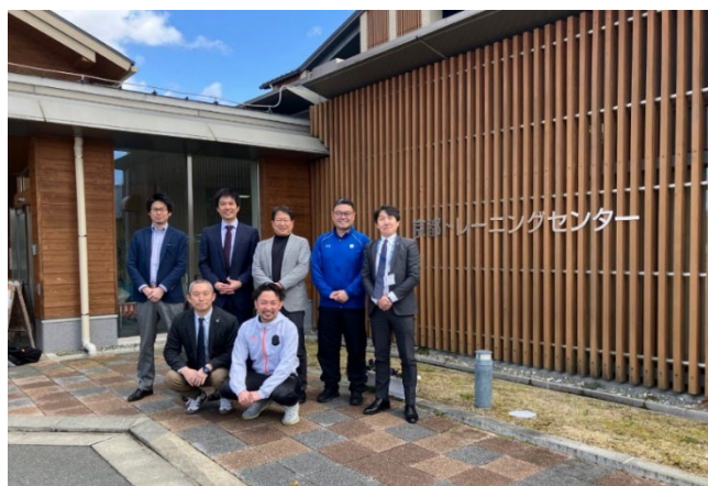
▲京都トレーニングセンター訪問の様子