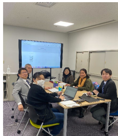
▲川端氏と和やかな意見交換

今回いただいた情報や要望を参考に、より良い事業運営を進めていきたいと思っております。